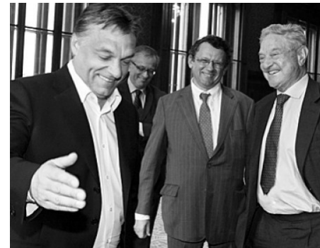
A mosolygó Orbán Viktor fogadja a Parlamentben Soros Györgyöt 2010 októberében

Jön az újabb nemzeti konzultáció – megint Soros Györggyel és a migránsokkal riogatnak majd minket. Közben értelmetlenül elköltenek egymilliárdot a nekünk küldött levelekre és több milliárdot hirdetésekre. Nem lehetne értelmesebb dolgokra fordítani az ország pénzét?