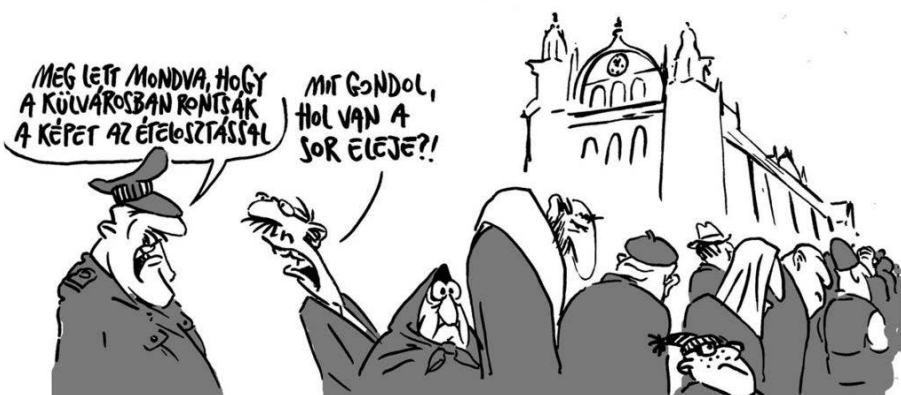
Pápai Gábor rajza – Népszava