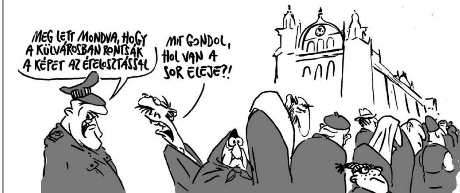
Pápai Gábor rajza – Népszava