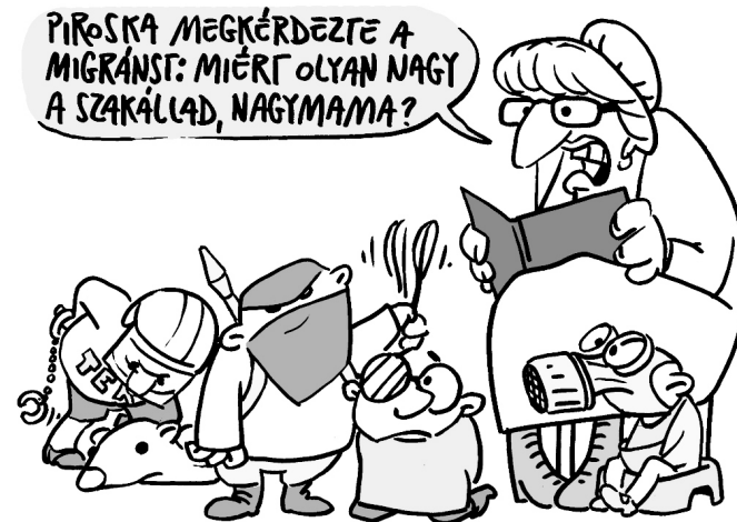
Illusztráció: Pápai Gábor – Népszavva