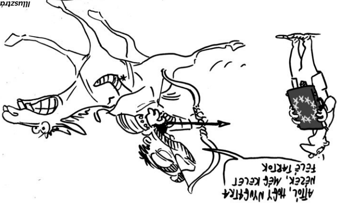
Illusztráció: Pápai Gábor

A Freedom House nevű nemzetközi szervezet, amely évente megvizsgálja a demokrácia állapotát a világ összes országában, a napokban tette közzé jelentését. A régiókból Románia 84, Lengyelország 85, Horvátország 86, Szlovákia 89, Csehország és Szlovénia 93, Ausztria pedig 94 ponton áll, az EU 28 tagállamából 16 is 90 pont fölött jár, vagyis a világ legdemokratikusabb országai közé tartoznak. Forrás: www.hvg.hu