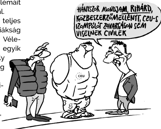
Illusztráció: Pápai Gábor - Népszava