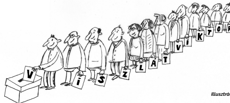
Illusztráció: Pikler Éva

Ami most a legfontosabb, hogy legyen rendszerváltás, ezt pedig a minél