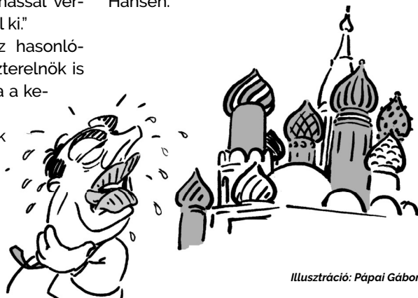
Illusztráció: Pápai Gábor

„Magyarországon arra használják az (újságok) felületeit, hogy az idegengyűlöletet szítsák. Amelyből aztán nem egykönnyen lehet kigyógyítani a társadalmat” – fogalmazott a lapnak Hendrik Hansen.