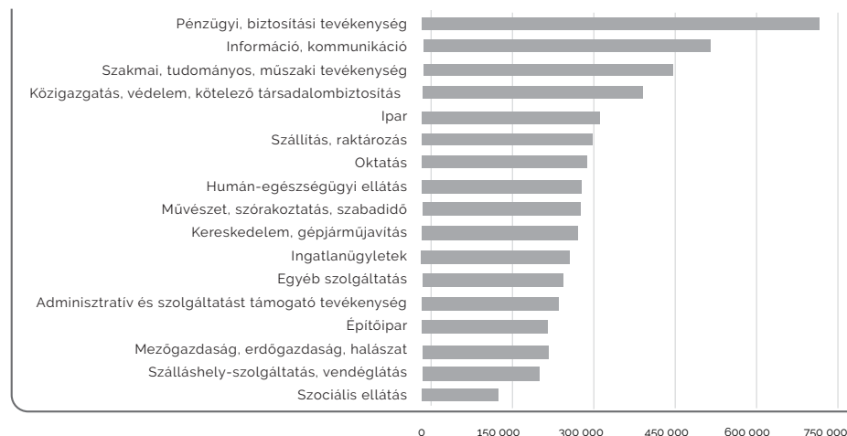
Alkalmazásban állók havi bruttó átlagjövedelme ágazatonként

Ez alapján európai összehasonlításban nagyon rosszul állunk. Az uniós statisztikák szerint a magyar társadalom alsó fele, az alsó öt tized, tehát a legszegényebb ötmillió ember, egészen pontosan ugyanott van az európai jövedelmi rangsorban, ahol hat évvel korábban. Viszont ahogy feljebb haladunk a jövedelmi ranglétrán, egyre nagyobbat sikerült előrelépni. A legjobban éppen a leggaz-