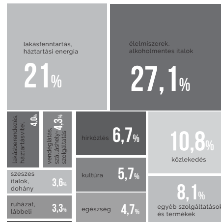
A háztartások kiadási szerkezete, 2017 részesezés az összefogyasztásból, százalék

A családi költségvetéseket a KSH szerint az előző esztendőben végül is nagyobb mértékben terhelték meg a szeszes italokra és dohányárakra (3,6 százalék) költött összegek, mint a ruhaneműre és lábbelikre (3,3) fordított pénzek. A háztartások egészségügyi kiadásai az otthoni büdzsét 4,7 százalékkal csapolták meg, ami fejenként és havonta 3874 forintot jelent. Ennek a pénznek közel a 60 százalékát gyógyszerekre, 15 százalékát pedig vitaminnokra, gyógykészítményekre költöttük.