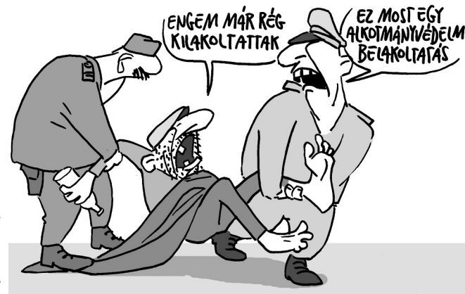
Papai Gábor rajza

Az mindenesetre önmagában is szomorú, hogy az immáron közel egy évtizede kormányon lévő Fidesznek lényegében nincsen más gondolata vagy üzenete az