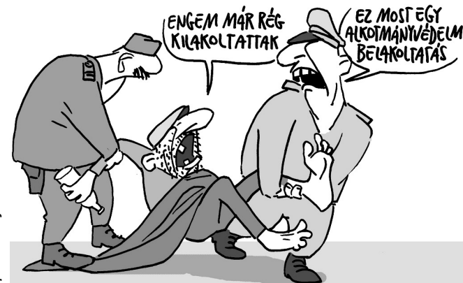
Papai Gábor rajza

Az mindenesetre önmagában is szomorú, hogy az immáron közel egy évtizede kormányon lévő Fidesznek lényegében nincsen más gondolata vagy üzenete az