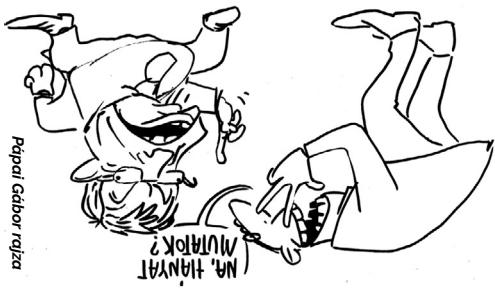
Papai Gábor rajza

Az OLF 2015-ös kezdeti nyomozni két magyar nonprofit kutatóközpont ügyében, mert papíron távmunkában foglalkoztattak embereket, de valójában egy budapesti irodában zajlott a munka. Amikor ellenőrzés jött, akkor a papíron vidéki telephelyeken dolgozó embereket e-mailben arra utasították, hogy a látszat kedvéért jelenjenek meg a megvalósítási-OLAF szerinti csalással, egymással egyeztetve, a piaci árnál jóval drágábban vállalt el megbízásokat, és nem létező irodák költségét írta le két budapesti cég. A hivatal még tavaly decemberben értesítette erről a magyar hatóságokat, de mostanáig senkit nem hallgattak ki az ügyben gyanúsítottként – írta meg a 24.hu hírportál, így foglalta össze az ügyet: „durva túlárazás, kamuíródak, 403 ezer forintos orabéért megírt tanulmány”.