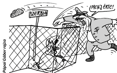
Pápai Gábor rajza

A jogvédők ebben az esetben is a strasbourgi bírósághoz fordulnak, amely korábban már kimondta, hogy a magyar állam nem éheztesse a menedékké-