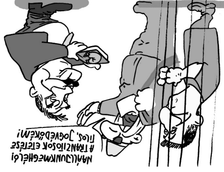
Illusztráció: Papai Gábor – Népszavva

lenséget. Gruevski Vlagyimir Putyin ked-