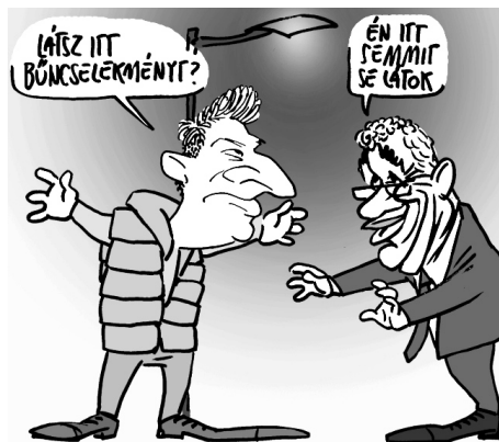
Illusztráció: Pápai Gábor – Népszava

(A magyar kormány előszeretettel használja ezt a módszert, ha már nem tud kimenekülni a csalás vádjá alól. Ez történt Orbán veje, Tiborcz István esetében is, amikor a költségvetésből, vagyis a