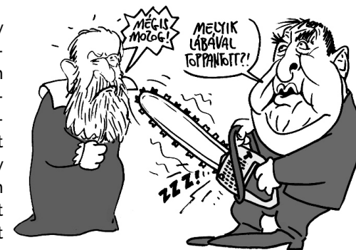
Amikor elítélte az inkvizíció Galileit, mert azt tanította, hogy a Föld forog, a legenda szerint a tudós mérgesen toppantott, és ezt kiáltotta: És mégis mozog!

A kiszivárgott dokumentumokból egyebek mellett kiderül, hogy az MTA-ról